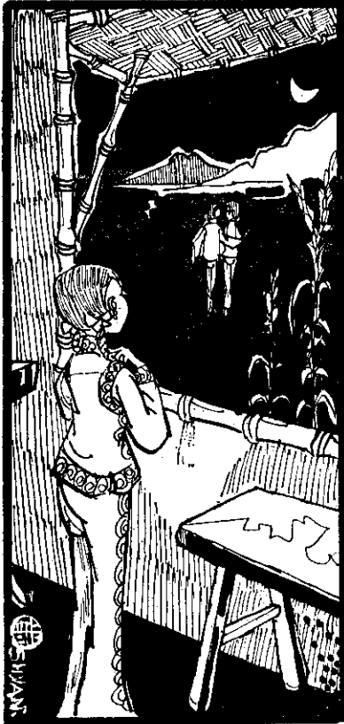
月色光照西窗，抬頭看見伊兩人。

日子一天一天地過去了，一直到現在，那隻可憐的蒼蠅媽媽，還癡癡地在那兒等待着她的孩子回來。可是，她就不知道，那些不聽話的孩子，因為忘記了媽媽的教訓，已經永遠不能再回來了呢！