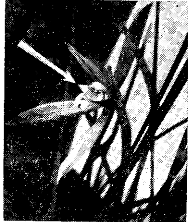
——蔥蘭花瓣的畸形變異——