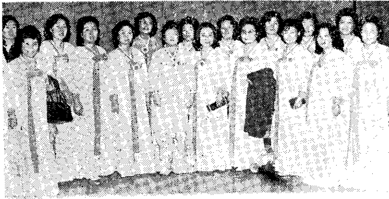
韓國運慶合唱團來華訪問

每年將增加勞動力十八萬人，到民國六十五年，失業率將由目前的三·四％降為三·二％。