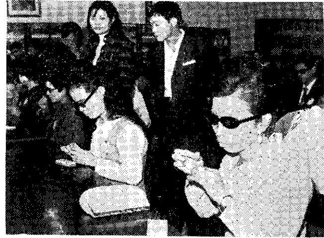
台北市盲人福利會舉辦的盲人穿針比賽

謝主席說，栽植花木需經多年的時間，才能綠蔭滿枝，成為美麗的風景，如果不經仔細考慮即予砍除，實是莫大的損失。