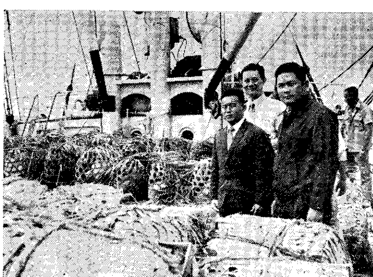
優良種豬運金門

麵食推廣會 招訓烘培員 台灣區麵食品推廣會招訓烘培從業員，初學，十五歲以下已服兵役男性。一月十五日至二十日報名。報名單及簡章，請向台北市南港區南港路一段二〇五號索取。