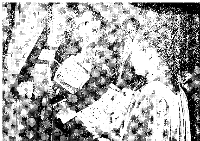
甘比亞總統賈瓦拉為非洲文物館剪綵後及與擊鼓