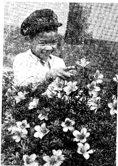
你看，杜鵑花開得多好！（呂福和）

生長勢強的枝條下部的枝條會枯萎，所以強枝必要剪除。支幹剪除之後，下部枝條保留稍長時，整株樹形看起來會有緊密而安全的感覺。