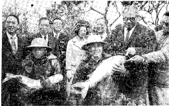
來華訪問的東加王國總統杜培勒哈(右二)參觀淡水魚養殖

遺產及贈與稅法的制訂，旨在平均社會財富，其社會政策意義，超過於財政目的。贈與稅的立法，在我國為初創。遺產稅及贈與稅合併立法，是在防止以贈與方式逃避遺產稅。