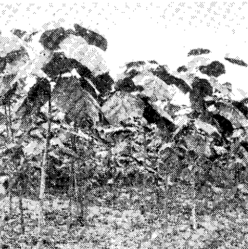
南投縣的泡桐苗圃

頃聞經濟部工業局計畫在竹山地區測繪興建約二十二公頃大規模竹木材加工區，這個計畫將使農工業配合，達到農村工業化的理想。 以上幾點，也許平淡無奇，可是在南投縣這個八十多山地的縣分，却是腳踏實地的工作。原先所標榜出去的「以林建縣」口號，總有一天會實現。