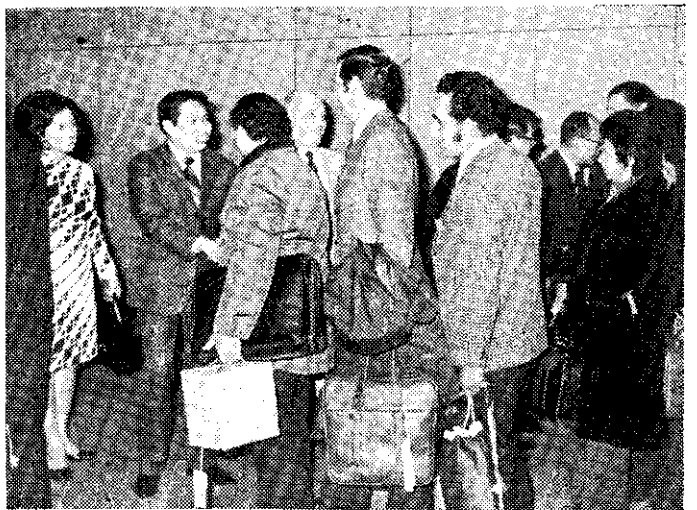
——中美洲經濟訪問團來華訪問(中央社)——