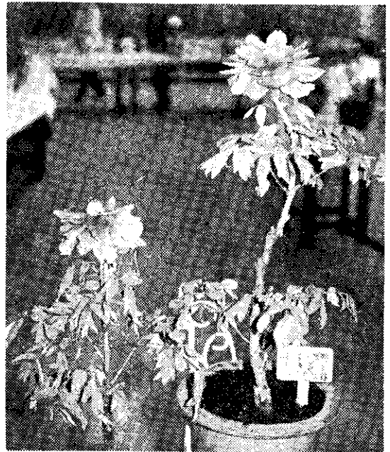
盛開的大玉（孫志浩）

清河種子行 地址：嘉義市中正路582號 電話：23584 郵政劃撥儲金嘉字第80037號