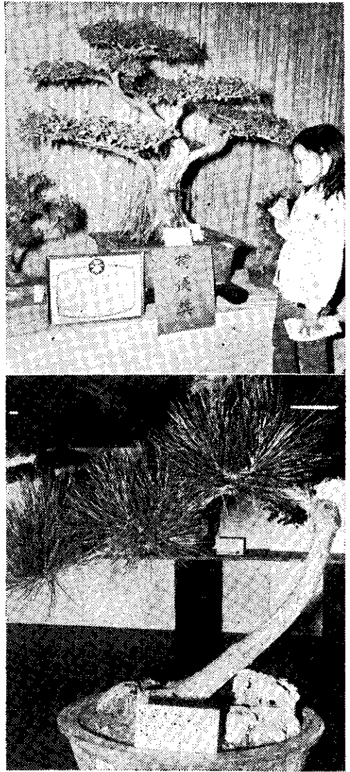
花展中的樹木盆景(白衛理)