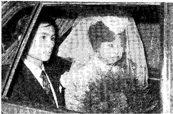
新婚甜如蜜，生兒育女不用急，兩三年後最適宜。（唐清振）