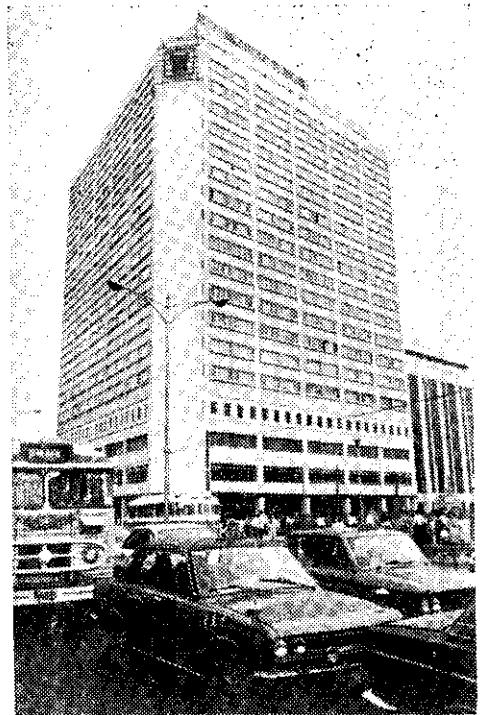
——台北市最高建築物，二十二層的台北希爾頓大飯店落成

雖然時代已經不同了，但在唐人街內，古老傳統的婚姻，仍被嚴格遵守。一個男人如果透過媒人發現了中意的小姐，就可以安排相親。如果雙方都感到合得來，就訂婚。整個結婚過程，在兩個星期內已經大功告成，而這些垂僑新郎官，也因觀光簽證的限制，無法在曼谷久留。