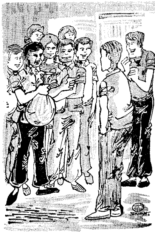
——阿威，你說過要戒酒，對不？——

「你別害死他，兩個月不喝酒，你要叫他渴死？」「不喝酒，別說兩個月，十天他就受不了！」大家七嘴八舌，說得我好不自在。