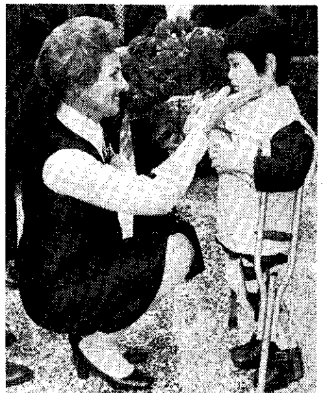
——哥斯達黎加費蓋萊斯總統夫人，參觀振興復健醫學中心，接受小朋友獻花。——

圖郵票，是以故宮博物院珍藏的「入蹕圖」為圖案，描寫皇城外迎接皇帝還都的儀隊，氣象雄偉。