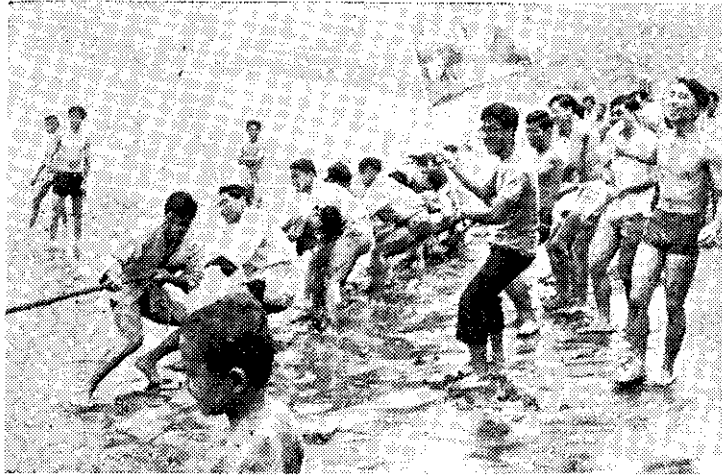
救國團團員金山海濱拔河比賽

為紀念這項富有深遠意義的決定，增進中美兩國的友誼，加州的美籍人士及華僑界人士，已發起