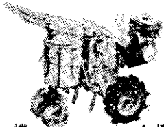
土壤消毒機 (三菱土壤消毒機盧筍、竹筍、花生等農作物均合用)