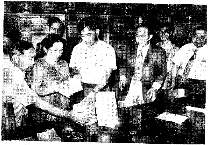
台灣銀行供應台北中央市場大量一元券幣

，但由於新券使用不凸版機印製，且改用美國紗紙及歐洲油墨，所以正面黑色較原發行的舊版壹圓券爲淺。