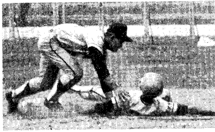
青少棒比賽的精彩鏡頭 (中央社)

蔣院長說：興建北迴鐵路，對於政治、經濟、文化乃至軍事，均有重大影响，應籌妥財源施工。