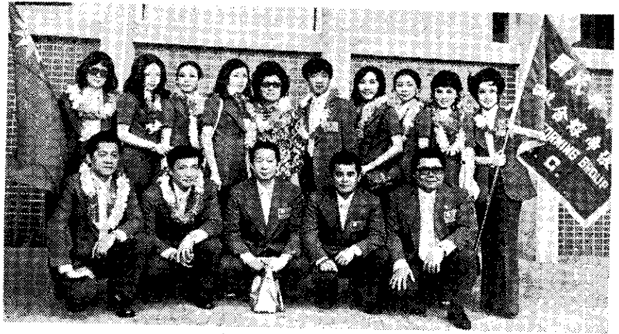
張帝綜藝團出國演出

教育部說，該部現正就取締電視靡靡之音的流行歌曲問題，與有關機關進行協調，以期作有效的管理。