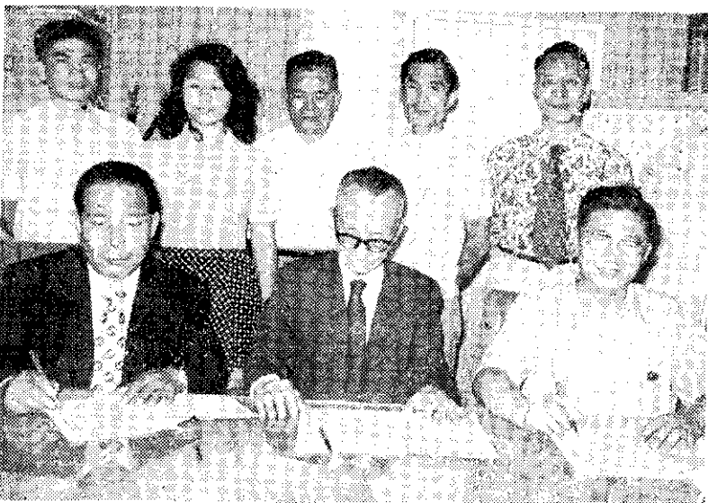
中日雙方代表在台北簽訂花卉銷日合約 (中央社)