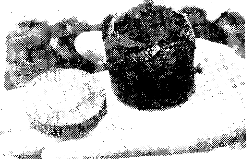
(左) 未浸水、(右) 浸水後的泥炭苔苗鉢