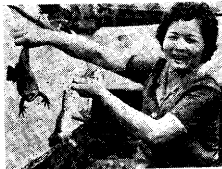
種蛙論隻賣，價格奇高！