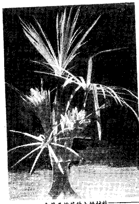
牽草是棉花的好材料