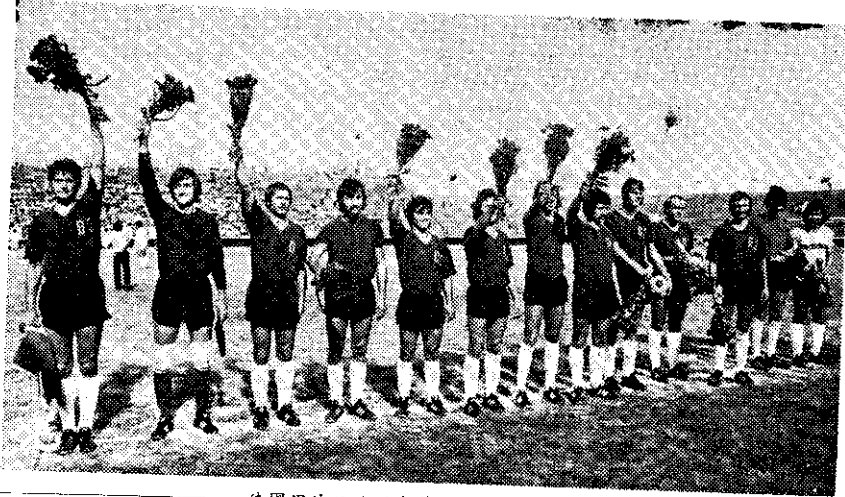
德國黑沙足球隊來華比賽 (白衛理)

中華民國少年棒球隊——巨人隊，八月一日以優異的球技，絕對性的優勢，以十九比〇大勝韓國隊，保持了連續五年來長勝的紀錄，榮獲遠東區少年選拔賽的冠軍，將代表遠東區參加八月二十二日在美國威廉波特舉行的世界少年棒球錦標賽。