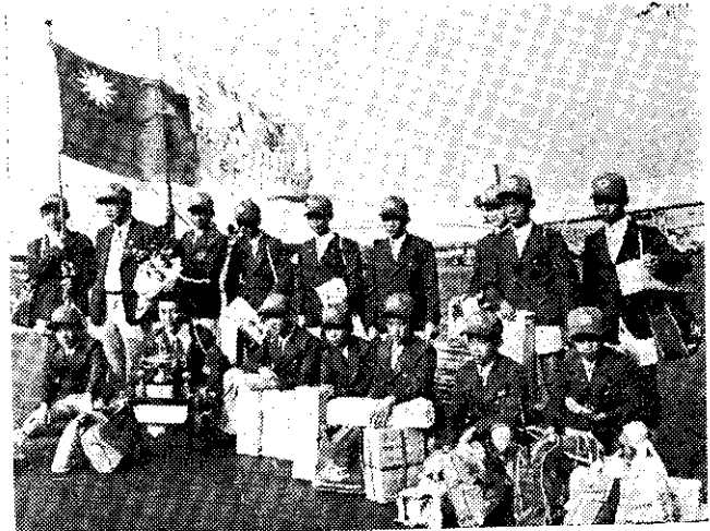
——中華巨人隊榮獲遠東區少棒賽冠軍由漢城凱旋歸國——