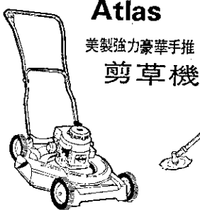
Atlas 美製強力豪華手推 剪草機