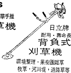
日立牌 耐用·壽命長 背負式 刈草機 環境整理，果樹園雜草 牧草，河川堤，道路草等