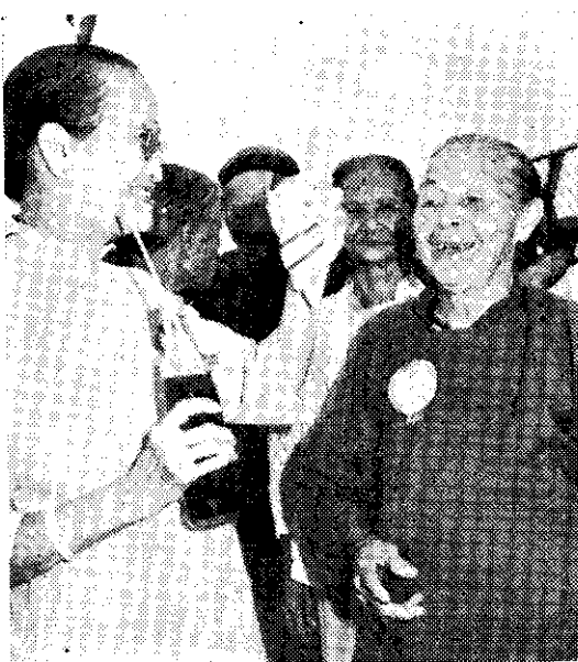
阿公阿婆暢遊台北(中央社)

這種通信教育，相當於我國函授學校，依教育部訂頒的函授學校(班)設立辦法規定，函授學校學生都沒有學籍，所以日本近畿大學通信教育，教育部依法不予承認，希有志入學者注意。