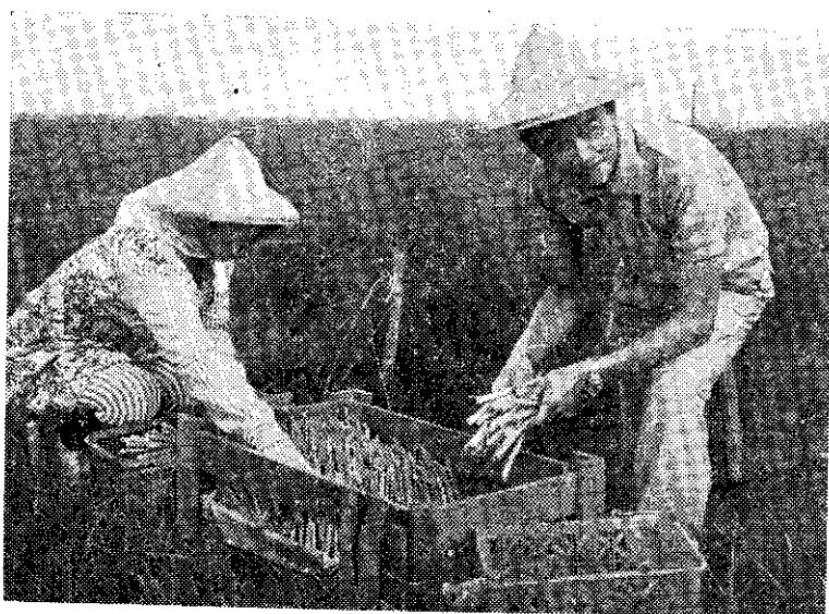
綠蘆筍採收裝箱 (林吉耶)

此次花展主要展出的項目是觀賞樹木，因香港政府目前正積極推行綠化環境運動，需要觀賞樹木數量很多。花卉協會表示，香港方面所需花木種類，台灣都能供應。