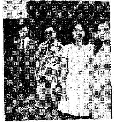
——韓草根大使(中間兩位)訪問順隆種苗園(江嵩邨)

台中區學校四健會總幹事會議，於九月二十五日在省立大甲農工舉行，商討分區聯合舉辦各項活動。爲便利會員相互觀摩，決