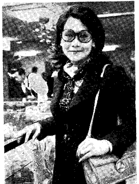
名歌星陳芬蘭返國探親

方案中明白規定，為使誤入歧途，參加不良幫會組織之青少年，有自新之機會，凡在中華民國六十二年十二月三十一日以前向警察機關自首解散者，既往不究，其觸犯刑法及違罰法者，依法免刑或減輕其