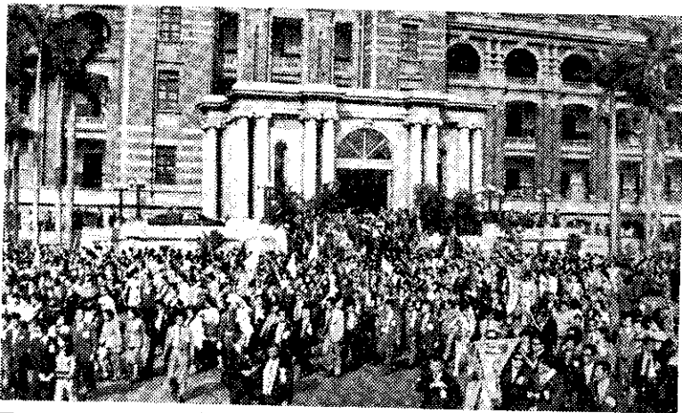
在總統府簽名祝壽的人潮