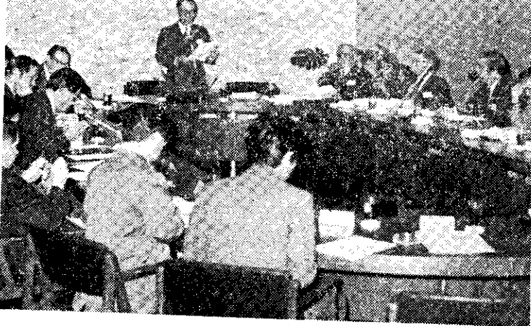
中美農業發展研討會 (中央社)