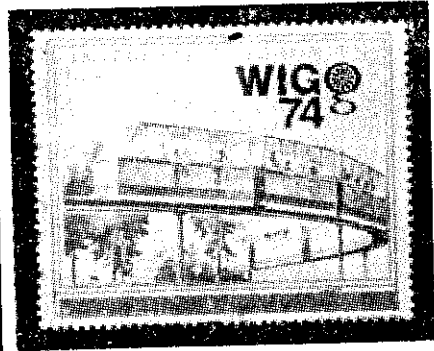
維也納國際園藝發展發行的紀念郵票（周鎮）

凡農魚民合作組織，與建倉庫及廠房，或改善有關運銷設施者。⑤配合農村建設貸款的各項專案性計畫。