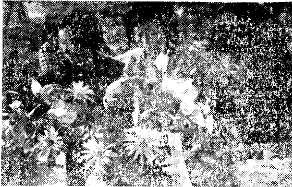
人造花製做訓練（卯正月）

將來擬辦理高級班的訓練，如果人數過多，將採考試方式，成績優良者優先，並酌收學費，材料費仍由農會免費供應。（宗）