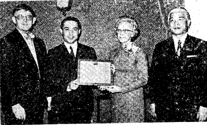
——美籍華女士在華担任護理工作42年，返美前夕接受表揚。

据中油公司表示：處理場地的供氣，要三個月後才能全量生產，生產能量是每天一百五十萬方公尺的天然氣。除了上