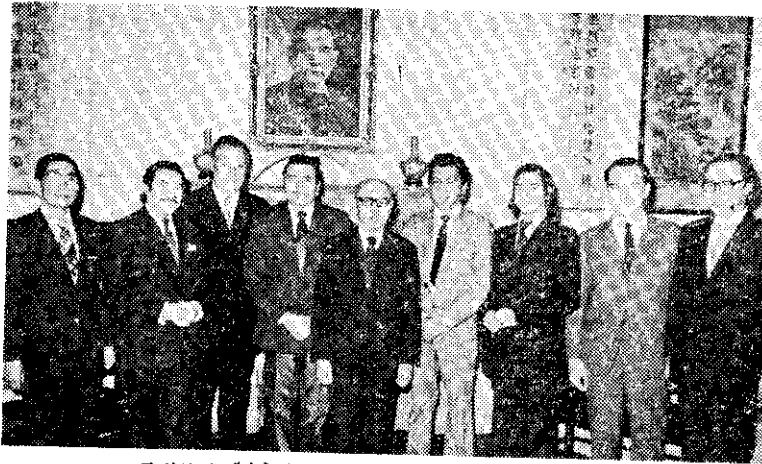
展副總統(中)接見巴拉圭南美洲丁音樂團

有些預售房屋的廣告中，不但尚未領到建築執照就開始預售，甚至連建築基地都沒有，或土地根本就無作建築使用的，而一般訂購人又疏於查察而蒙受損失。