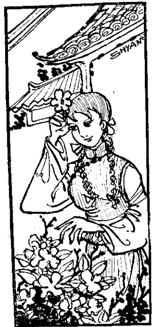
春天春天花兒開 姐兒採花頭上戴 花兒清香姐兒甜 姐兒想啥讓你猜

幸而橋底下有着厚厚的積雪，沒把牠們摔死。阿胖清醒過來以後，發現自己躺在鬆軟的雪堆裏，一點兒也沒有受傷。牠很高興地爬起來，四面看看，正想繼續趕路，却意外的發現鬼靈精也倒在一塊尖銳的石頭邊。牠一邊淌着血，一邊痛苦的呻吟着。阿胖覺得鬼靈精也着實可憐，竟忘了他的陷害，跑去把牠扶起來，一直送牠回到家裏。