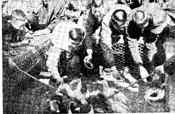
慶祝農民節中興新村園遊會(阿明)

何局長指出：這項當前地政業務的艱巨工作。完成後，不僅對台省的土地狀況可一目了然，並可作為今後使用土地的依据。