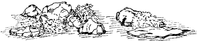
模倣自然山景的山石組合

如下圖所示，景石常為庭園之中心，成為庭園的焦點利用這個景石為前景，獲得借景上最好的效果。