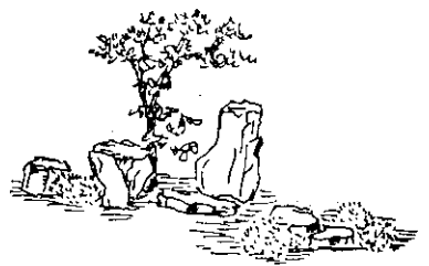
當主景的岩石組合