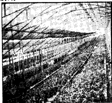
溫室、洋菇場屋頂用

溫室、體育場、看台、車庫、車棚、遊樂場所、工廠、宿舍等屋頂、隔間，採光、透光材料，美觀而經濟耐用。