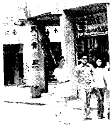
貢糖是金門的特產