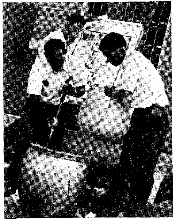
波爾多液調製講習