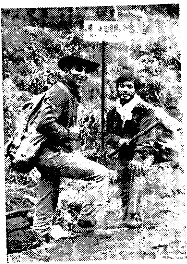
兩山地青年登山途中相逢(呂福和)