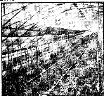
溫室、洋菇場屋頂用

溫室、體育場、看台、車庫、車棚、遊樂場所、工廠、宿舍等屋頂、隔間，採光、透光材料，美觀而經濟耐用。