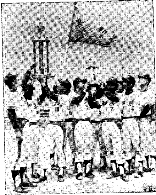
青少棒冠軍美和隊高舉銀杯