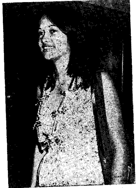
關島皇后吉莉萊小姐來華觀光