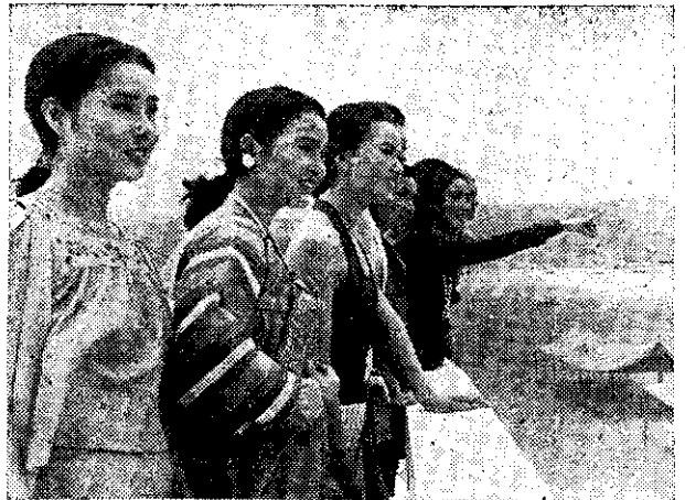
參加亞洲影展的影星們在金山欣賞海濱風光

這次參加亞洲影展的，來自九個國家及地區，包括三百多位電影界人士。開幕典禮是由行政院新聞局長錢復主持，