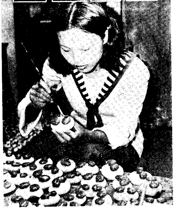
家庭手工藝 (白術理)