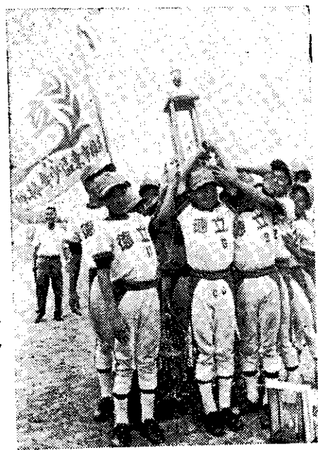
全國少棒賽冠軍高雄立德隊

遺產及贈與稅法施行前已發生的遺產繼承，因特殊原因未辦登記及未申報遺產稅，可在六四年六月三〇日前補報免罰。