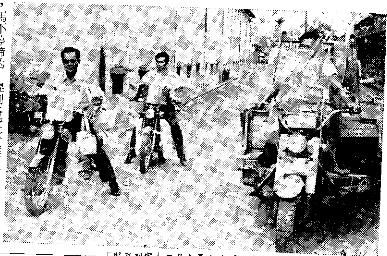
「服務到家」工作人員出發 (鮑國琛)

這幾天，二崙鄉農會為了無息貸款還谷工作，大家忙碌起來。特別是供銷部幾位先生，席不暇暖，有時候還得動員推廣股或信用部的人，一同出門