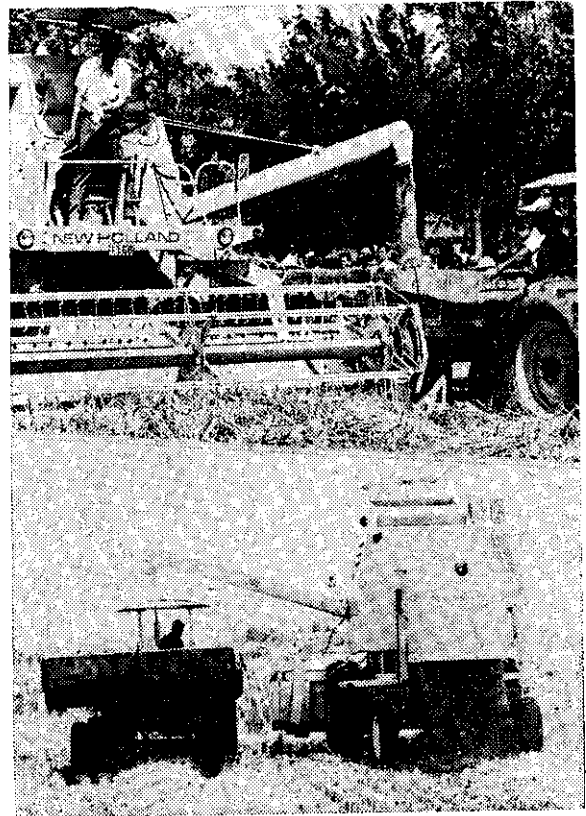
新型水稻收穫機田間操作

台糖公司接受經濟部加速農業機械化推行小組的委託，日前在溪湖糖廠溪州農場舉辦新型水稻收穫機械操作示範表演。 台糖公司這次示範所使用的水稻收穫機，是由比利時引進的克來遜一五二〇型水稻收穫機。全機包括切割、脫谷、分離、清淨及收集等五個主要部分。在長一百公尺，幅寬五十公尺的農地，操作效率最好。 這種水稻收穫機的優點是能量大，每日可採收水稻三、三、五公頃，用人省單位收割成本低，在全倒伏的稻田中也可以採收。 這種機械由於機體較大，操作