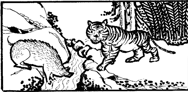
老虎說：「喂！大笨蛋，是誰叫你到這兒來的？」

老虎抬頭看，果然看到了十幾隻禿鷹在空中盤旋着，心裏有點兒害怕，於是就答應和野豬做朋友。一面故作大方的說：「這裏泉水很清涼我們一塊兒來喝吧！」