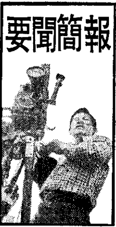
雙邊貿易及經技合作。 澄清史實 正義伸張 在日本產經新聞連載的「蔣總統秘錄」

蔣口，侵犯台灣併吞琉球。仍不滿足，更想進一步併吞朝鮮。於是展開了中日之間對朝鮮問題的交涉。