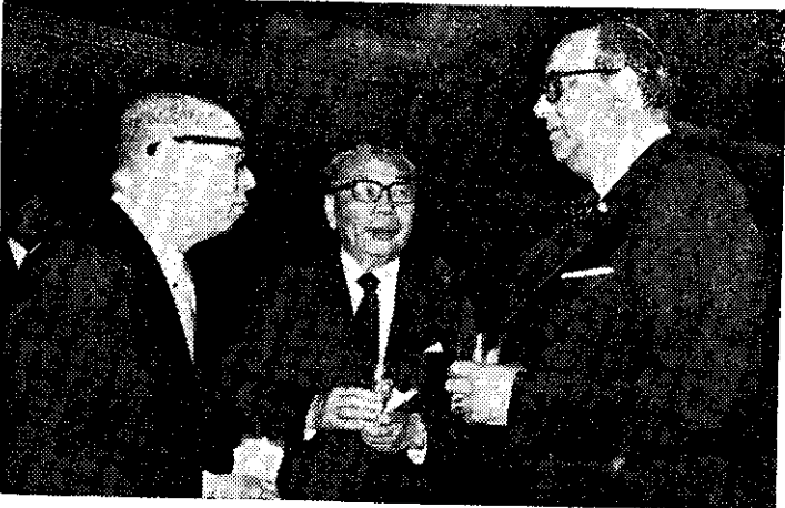
嚴副總統和蔣院長向蘇慕薩將軍(右)祝賀尼國國慶(中央社)