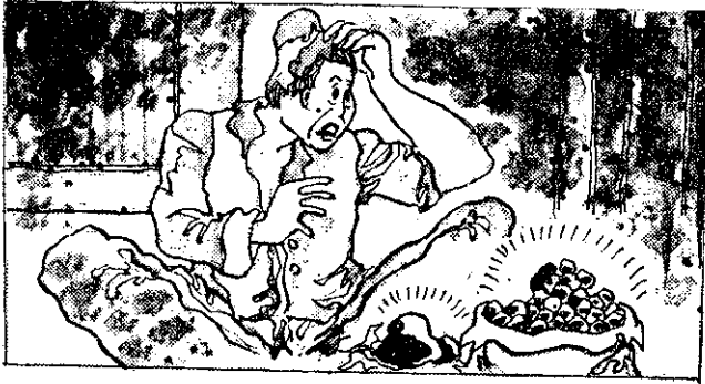
木蓮果變成小石子，偷來的銀兩原來是一大塊泥土

有一次，霧山莊的阿峒，前來採摘木蓮。因為路途遠，清晨出門，來到雲山莊的山廟，已經是夕陽西下的時候，只好在這裏過夜。