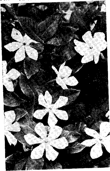
金門盛開的黃梔花

黃梔味苦性寒，為消炎解熱中藥，據說可治多種炎症，同時也是黃色染料植物。(呂福和)