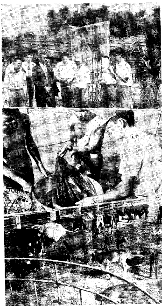
上：經濟部長視察試驗村，中：捉魚，下：肉牛飼養

2. 多年來農家相與繼承分割，土地零星分散，每戶如要維持農戶一家生活，靠一公頃耕地從事生產已無可能。政府為改善農業經營制度，防止土地再分割，設法擴充本計畫推行，乃為最佳辦法。 3. 貸款方面承蒙中國農民銀行及市農會通力支持合作，始能如期貸出，對各項業務經營才能依計畫進度推行，頗得農友贊許。 4. 本計畫組織農戶五四戶。共同投資經營，在此困難當中，仍能通力合作，確已打破農民守舊觀念，改變其傳統耕作方式，實施共同經營。