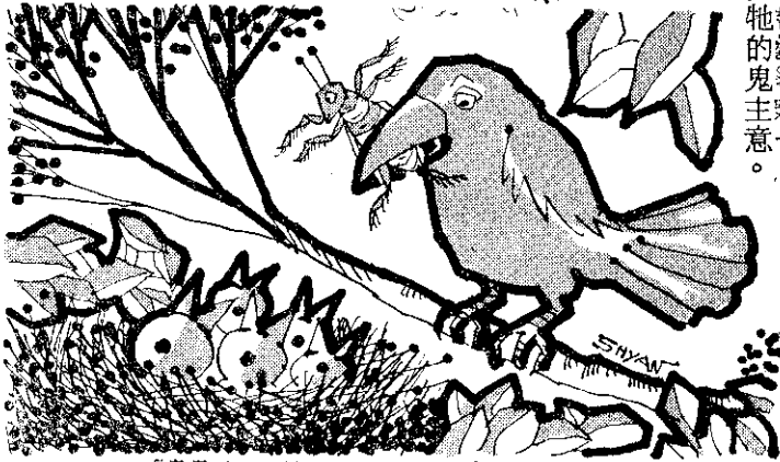
「寶寶別哭，媽媽這裡有好吃的東西給你們吃呢！」

「是嗎？哈哈！」蟋蟀小姐聽了，心裏非常舒暢。牠忽然忘形的笑着說，「您真會說話，您這樣贊美我，我真不好意思呢。」