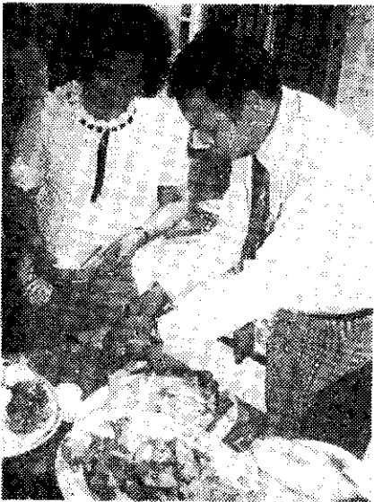
北市內湖區茶莊講習(詠風)

大豆單位面積產量，並加強病虫害防治技術，特於十月二十九日上午九點舉辦講習會，邀請高