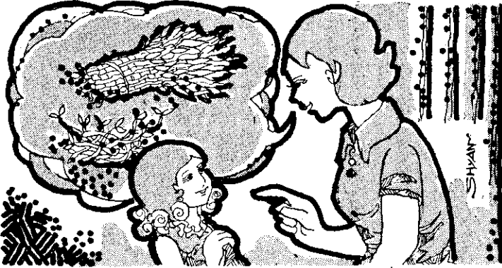
媽媽叮囑說：買一斤空心菜、一斤黃豆芽